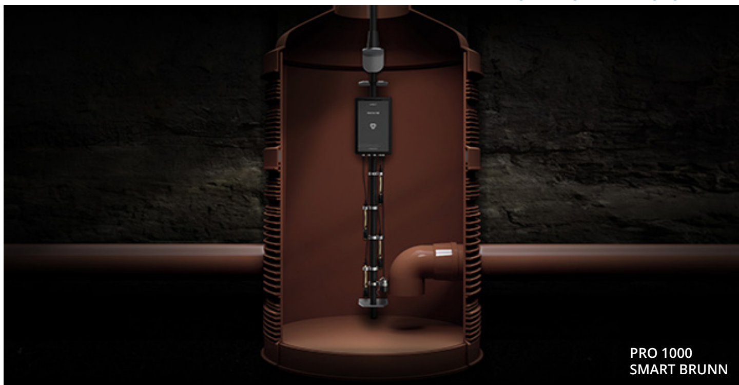
PRO 1000 SMART BRUNN